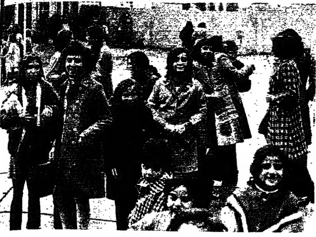
فرح عادت الطالبات الى المدرسة ■

« قلت « الاتوار » رسالة من السيد ميخائيل نعمه البيسري من بلدة قنات في قضاء بشري ، يقول فيها ان النائب الامريكي اللبناني الاصل ابراهيم الخازن ، هو من ابناء قنات . وكانت « الاتوار » قد تلقت رسالة مماثلة من السيد يوسف حنا الخازن من قنات نشرتها امس الاول الاحد .